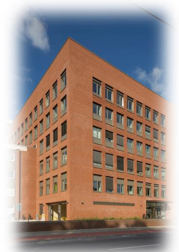
Ärztehaus Sankt Marien seit 2021